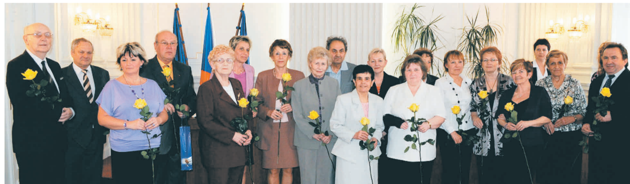
Letos u příležitosti Dne učitelů převzalo na radnici ocenění osmnáct krnovských pedagogů.