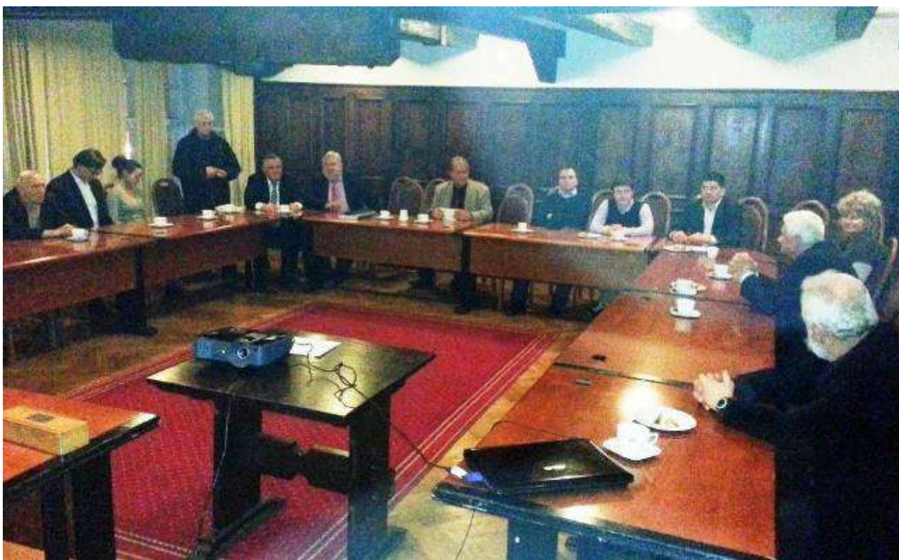
Schůzka RC Wroclaw dne 26. 11. 2012, na níž jsme byli hosty

Před 19. hodinou jsme se pak přesunuli do zasedací místnosti v podkroví hotelu, kde se každé pondělí scházejí členové PC Wroclaw a byli jsme hosty jejich pravidelné schůzky. Přítomnými členy klubu jsme byli srdečně přivítáni a po přednášce o slučování wroclawských vysokých škol, jsme představili náš klub a jeho projekty. Současně jsme členům klubu přednesli nabídku spolupráce našich klubů. Nabídka byla přítomnými wroclawskými rotariány přivítána a po výměně vlaječek a upomínkových předmětů se rozproutila neformální diskuse. Týkala se zejména klubových projektů, spolupráce na poli výměny mládeže a možností setkávání členů obou klubů. Odjížděli jsme až po 22. hodině s velmi dobrými dojmy a pocity z milého přijetí polskými přáteli. Navíc jsme si také odváželi příslib, že náš klub dne 5. prosince navštíví zástupci wroclawského klubu.