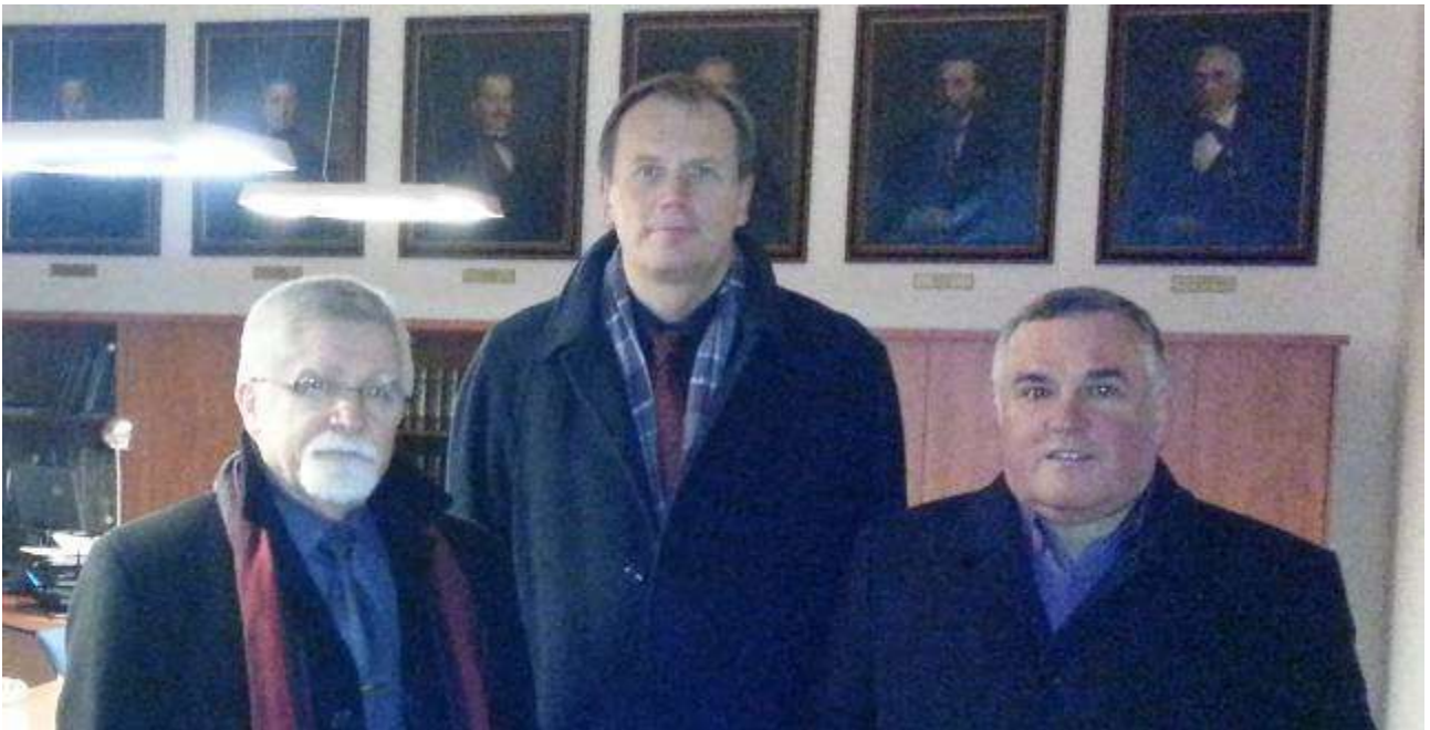
S představiteli RC Wroclaw v pracovně primátora města Opavy; níže debata v RC Opava International