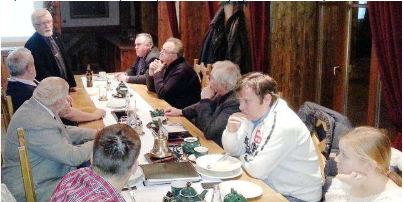
Na snímcích níže návštěvou na opavské Hlásce a předání dárků v klubu